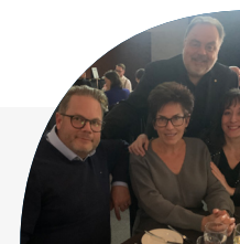
Photo prise à l'occasion du Gala de l'ordre du mérite coopératif et mutualiste 2023

Merci à nos membres pour leur exceptionnelle mobilisation lors de cette journée, et surtout merci aux aides à domicile au sein de nos EÉSAD pour leur travail dévoué au sein de nos communautés.